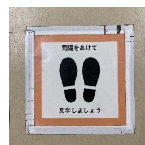
密を避ける 見学位置 マーク